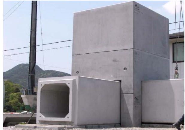
ボックスマンホール

道路、河川、下水、宅地造成などにおける各種土木製品の開発、生態系を含めた環境製品開発、景観、緑化と融合した製品開発はもとより、防災・耐震性を考慮した製品開発へと展開しております。