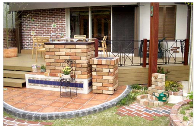
ガーデンシンク、立水栓

街並みに調和する外構づくり。 個性を演出するエクステリア。 個人住宅から店舗用製品まで幅広いジャンルで製品を提供し、ガーデニング関連、ペット関連等新たなテーマを掲げ、快適な空間づくりを追求しております。