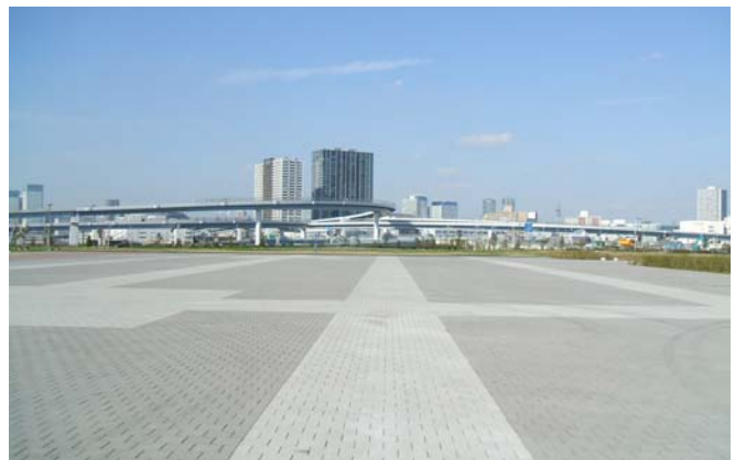
バリアフリーペイブTS（東京臨海防災公園）

人と自然にやさしい空間づくりの提案、共感の得られる環境製品の提供と、次世代まで引き継がれる豊かな公共空間の創造に努めております。