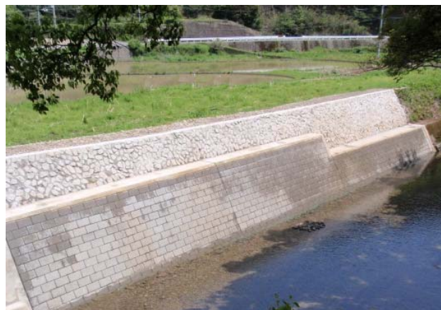
ベアポラス 350 (徳島県)

道路、河川、下水、宅地造成などにおける各種土木製品の開発、生態系を含めた環境製品開発、景観、緑化と融合した製品開発はもとより、防災・耐震性を考慮した製品開発へと展開しております。