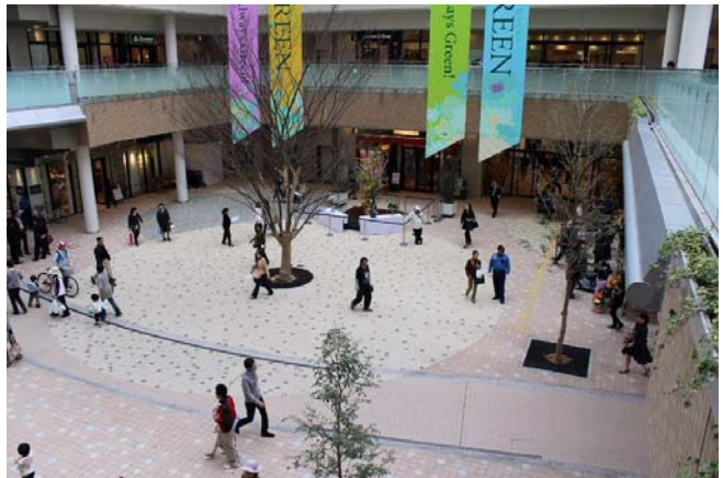
ベイブロックフェブ(高松市ノ丸亀町グリーン)

人と自然にやさしい空間づくりの提案、共感の得られる環境製品の提供と、次世代まで引き継がれる豊かな公共空間の創造に努めております。