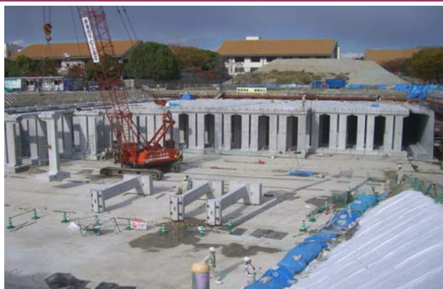
プレキャスト遊水池(姫路市/辻井川雨水貯留施設整備事業)

道路、河川、下水、宅地造成などにおける各種土木製品の開発、生態系を含めた環境製品開発、景観、緑化と融合した製品開発はもとより、防災・耐震性を考慮した製品開発へと展開しております。