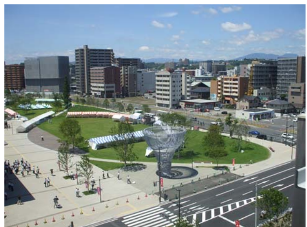
製品名：ピアンタコンクリートモジュール（JR大分駅）

人と自然にやさしい空間づくりの提案、共感の得られる環境製品の提供と、次世代まで引き継がれる豊かな公共空間の創造に努めております。