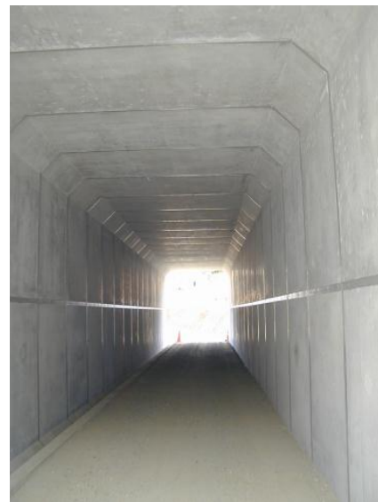
製品名：大型分割式ボックスカルバート サイズ：内幅 3500×内高 4300×長さ 1500 延長：30m 用途：道路下通路（尾道松江道）

道路をはじめとする老朽化対策や防災予算の増大に伴い、擁壁、側溝などの道路用製品や防火水槽などの貯留・防災製品が好調に推移したことにより、当セグメントの売上高は25億88百万円（前年同期比7.2%増）となりました。