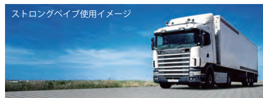
ストロングベイブ使用イメージ

最寄り駅は、JR 総武線「千駄ヶ谷駅」「信濃町駅」より徒歩 5 分、都営大江戸線「国立競技場駅」より徒歩 1 分。新宿区と渋谷区の境界線上に位置しており、国立競技場駅構内と出入口は、東側が新宿区、西側が渋谷区に位置しています。また、明治神宮外苑も歩いてすぐ。神宮球場での野球観戦やイベントなど、時間を忘れて楽しむことができます。周辺整備に重車両用舗装材「ストロングベイブ」、保水性舗装材「SAZARE 細石(さざれ)エコロアクア」をご採用いただきました。これからも活気に満ち溢れた楽しめる市街地形成に貢献していきます。