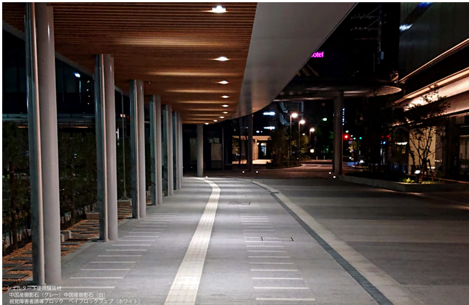
シェルター下使用舗装材 中国産御影石（グレー）中国産御影石（白） 視覚障害者誘導ブロック ヘイブロックフェブ（ホワイト）