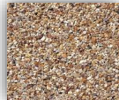
ディープブラウン