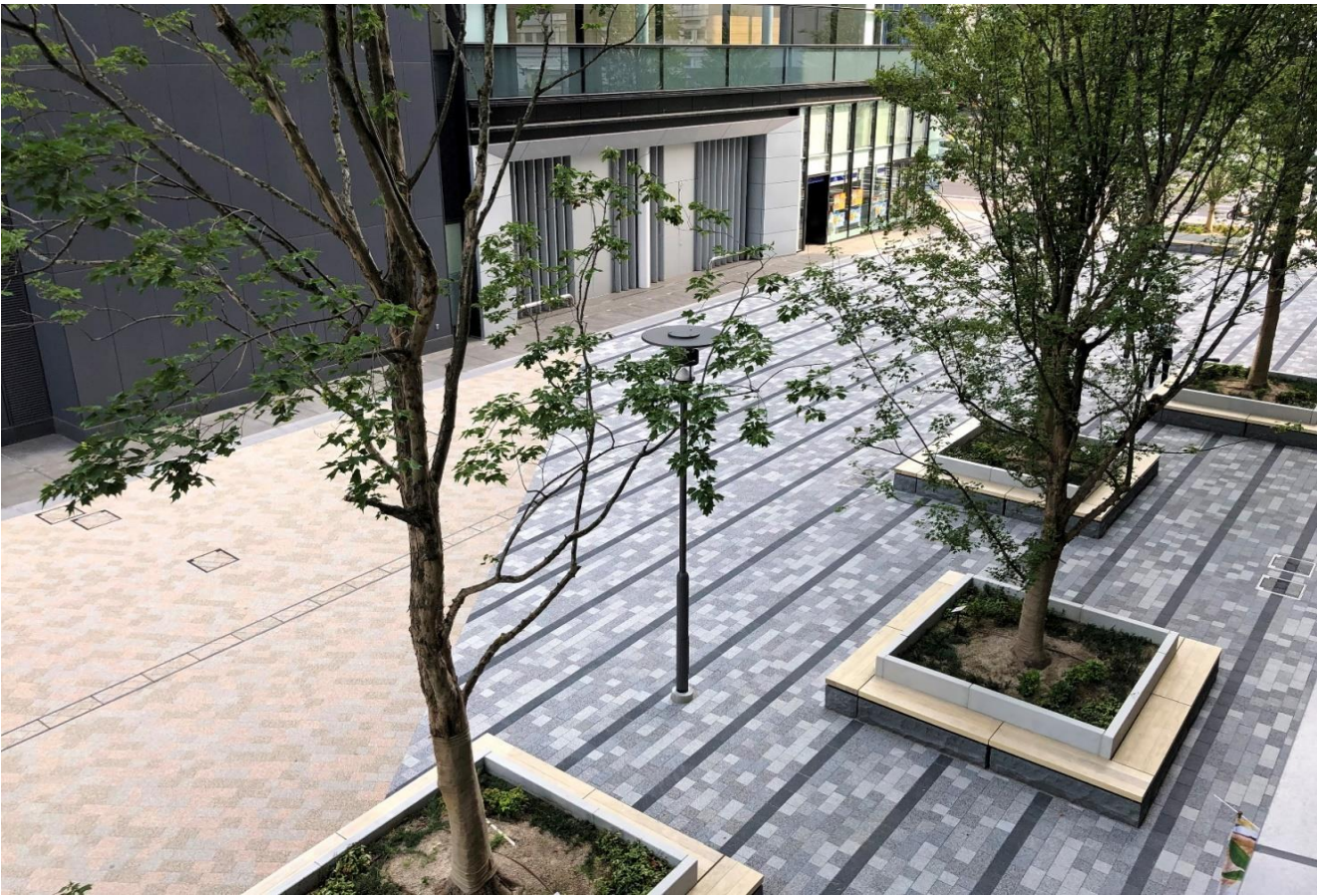
(仮)広島二葉の里プロジェクト