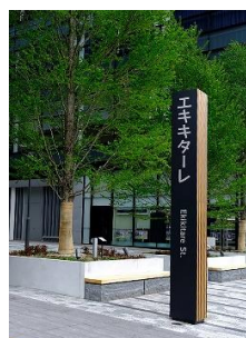
広島駅北口 通称「エキキターレ」