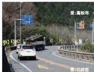
急カーブによる車両の逸脱状況

急カーブしている現道を直線化するためのバイパス整備を行うことで、車両の逸脱による衝突事故の防止と歩行者の安全を図ります。