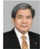
熊本県知事 蒲島 郁夫