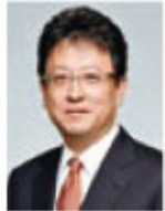
熊本県副知事 大西 一史