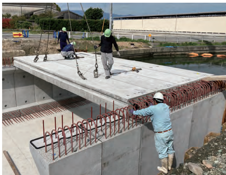
頂版スラブの据付