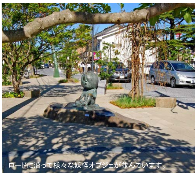
ロードに沿って様々な妖怪オブジェが並んでいます。