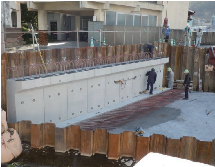
側壁ブロックの据付