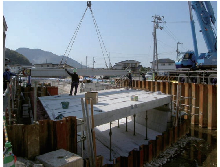
頂版スラブの据付