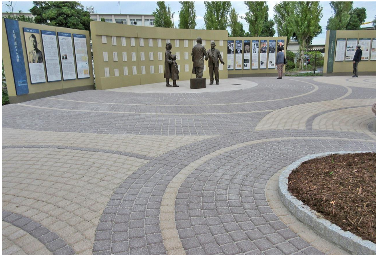
センポ・スギハラ・メモリアル