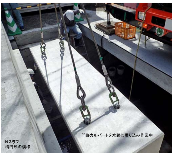
Nスラブ 楕円形の模様