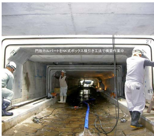
門形カルバートをNK式ボックス横引き工法で構築作業中