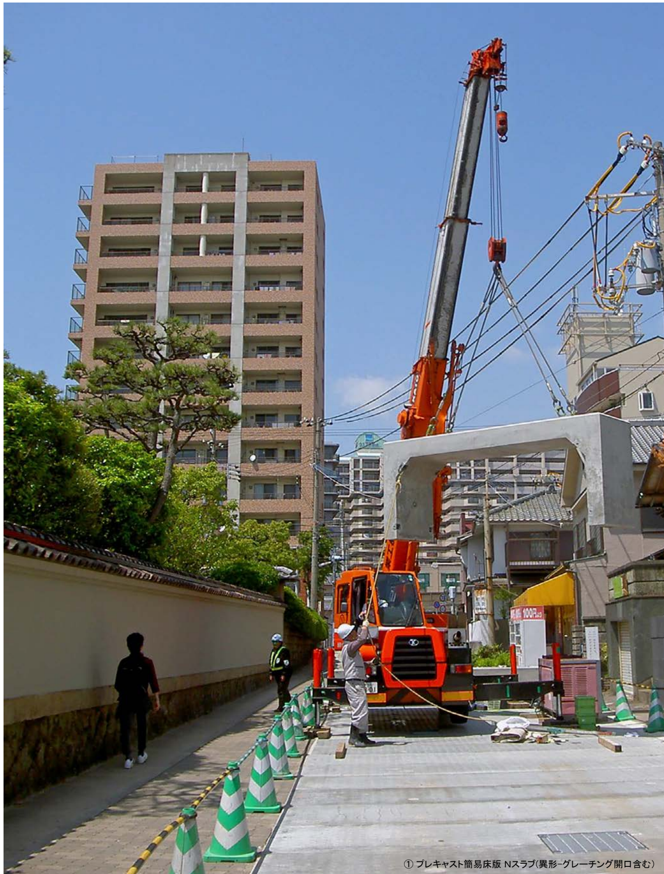
① プレキャスト簡易床版 Nスラブ(異形グレーチング開口含む)