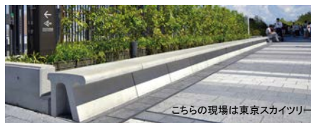
こちらの現場は東京スカイツリー