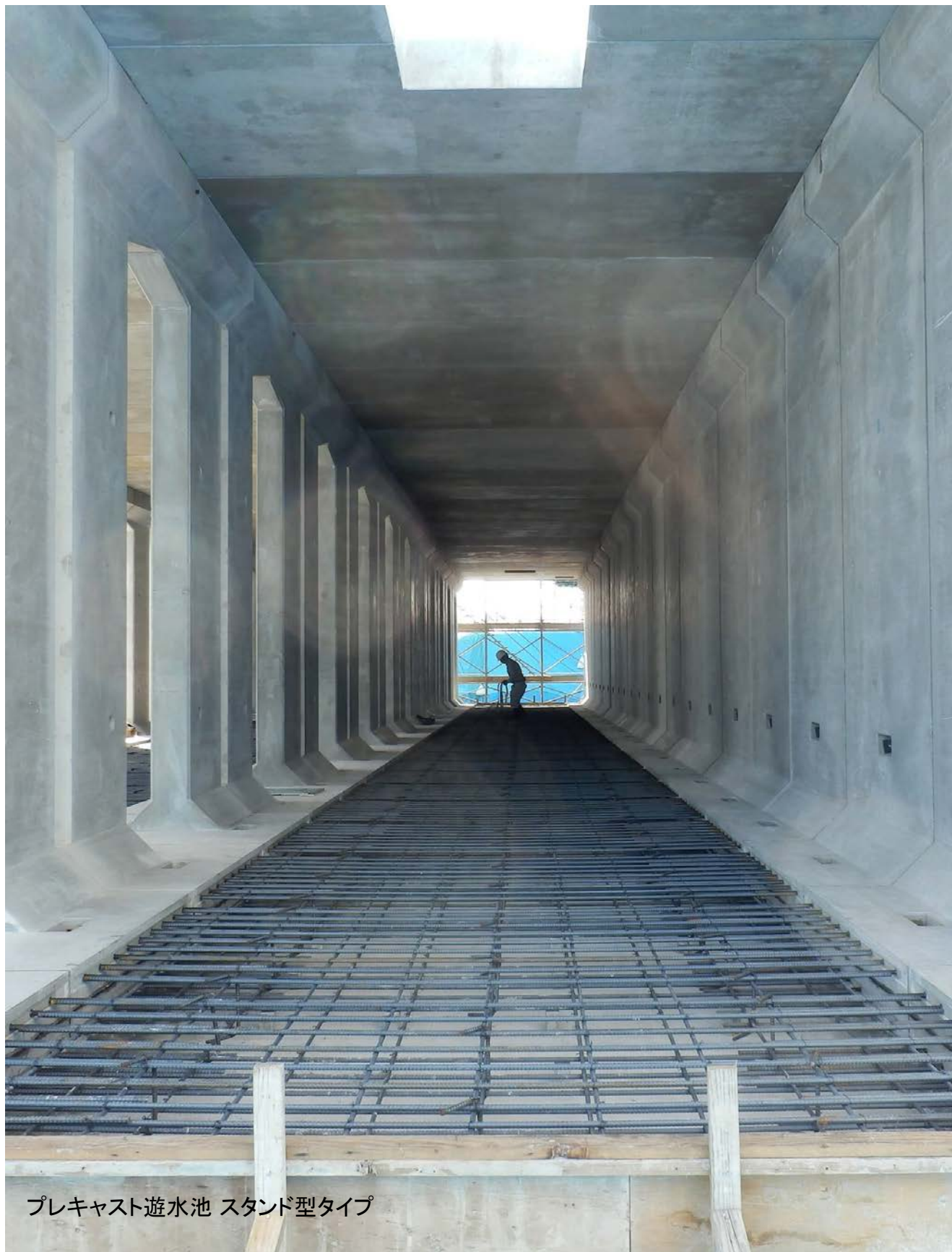
プレキャスト遊水池 スタンド型タイプ