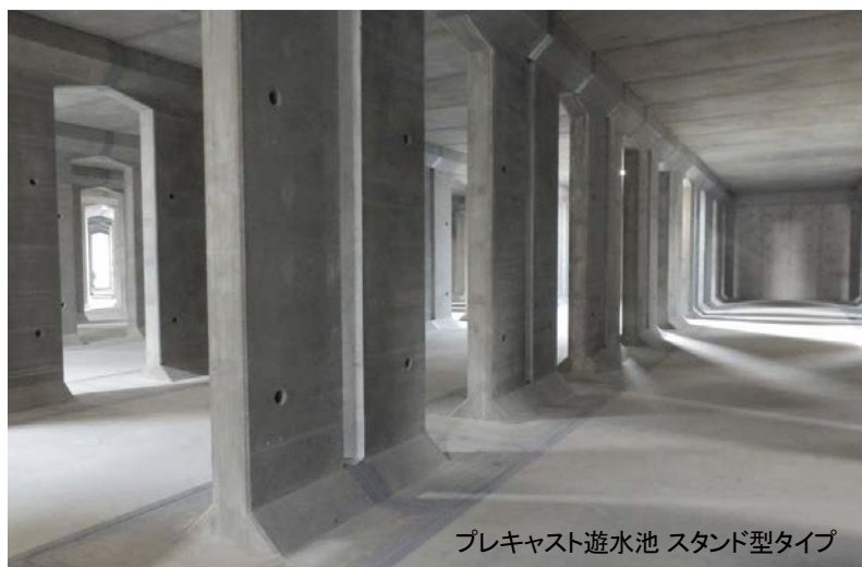
プレキャスト遊水池 スタンド型タイプ