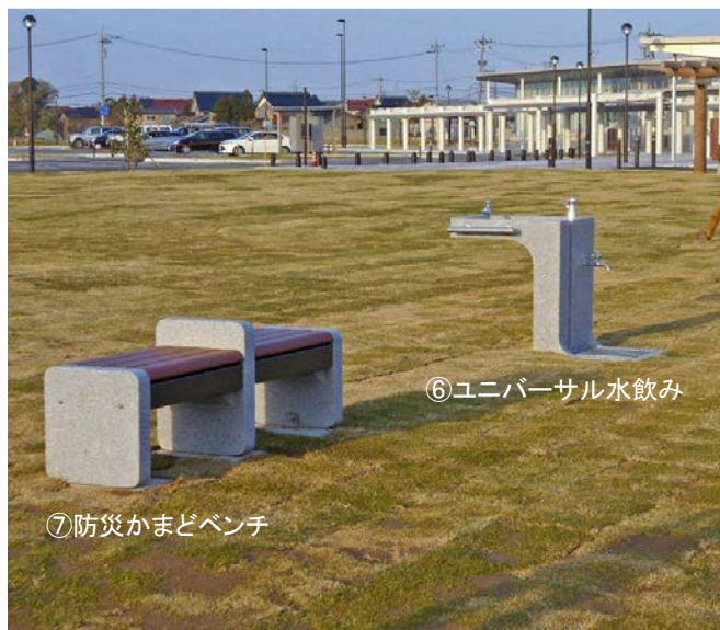
⑦防災かまどベンチ