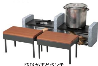
防災かまどベンチ