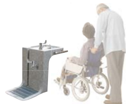
車椅子使用者が利用しやすい構造