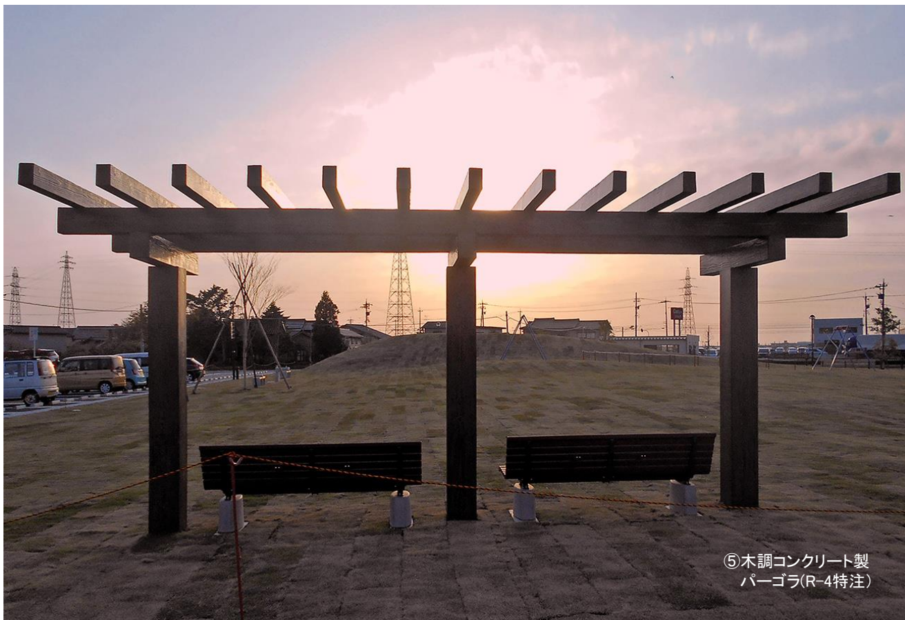
⑤木調コンクリート製 パーゴラ(R-4特注)