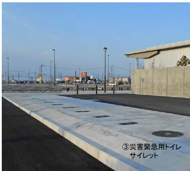
③災害緊急用トイレ サイレット