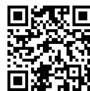
webカタログもご覧下さい

現場住所 宮城県本吉郡南三陸町志津川字袖浜地内 施主名 宮城県 竣工年月 2017年6月