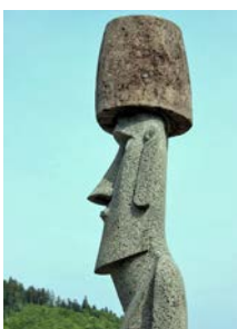
イースター島から贈られたモアイ像も見学できます！

南三陸町の志津川湾に東日本大震災以降7年ぶりとなる「サンオーレそではま海水浴場」がオープンいたしました。「サンオーレ」は砂浜全長の3(サン)0(オー)0(レ)300メートルに由来しております。真っ青の海と長く広がる白い砂浜、三陸の緑濃い山々と志津川湾の美しいコントラストが大勢のご来場者を魅了しております。2017年度の遊泳期間は8月20日で終了しておりますが、穏やかな渚を見ているだけで心地よくなります。リゾート地として明るい雰囲気と楽しい足元を創造する「ペイブロックジュニ」「ペイブロックフェブ」及びシャワー棟・トイレ棟を採用いただきました。