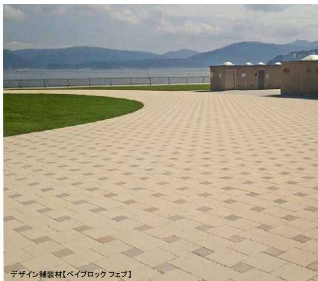
デザイン舗装材【ペイブロック フェブ】