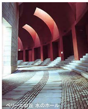
ペリーニの丘 水のホール

サンオーレそではま海水浴場前に採用いただいたデザイン舗装材「ペイブロックジュニ」は、弊社が30年前に初めて開発導入した舗装材です。1990年竣工の横浜ビジネスパーク中にあるイタリアの建築家【マリオ・ペリーニ】デザインの“ペリーニの丘 水のホール”にも採用いただいております。意のままにデザインできる意匠性は今でも時代を超えて愛されています。見ているだけでも楽しい張りパターンと雨天でも安全で滑りにくいショットプラスト加工の「ペイブロックジュニ」はお子様も多い海水浴場には最適です。