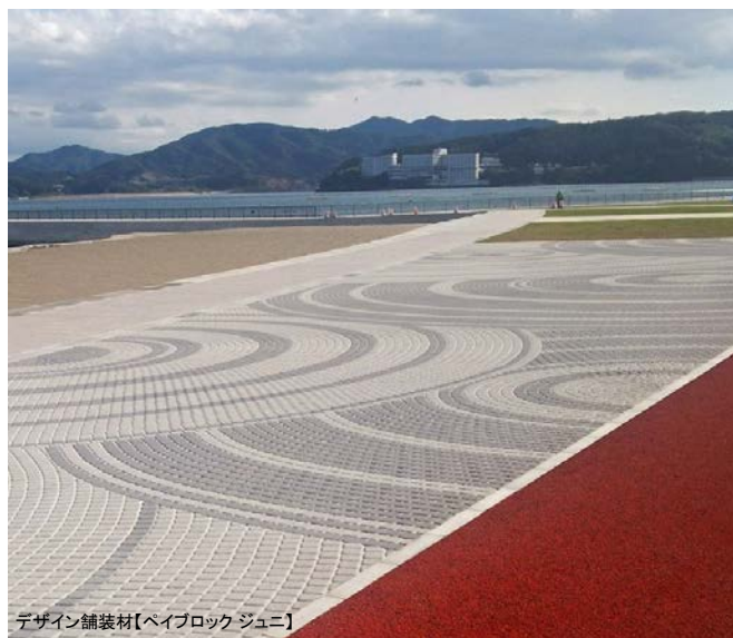
デザイン舗装材【ペイブロック ジュニ】