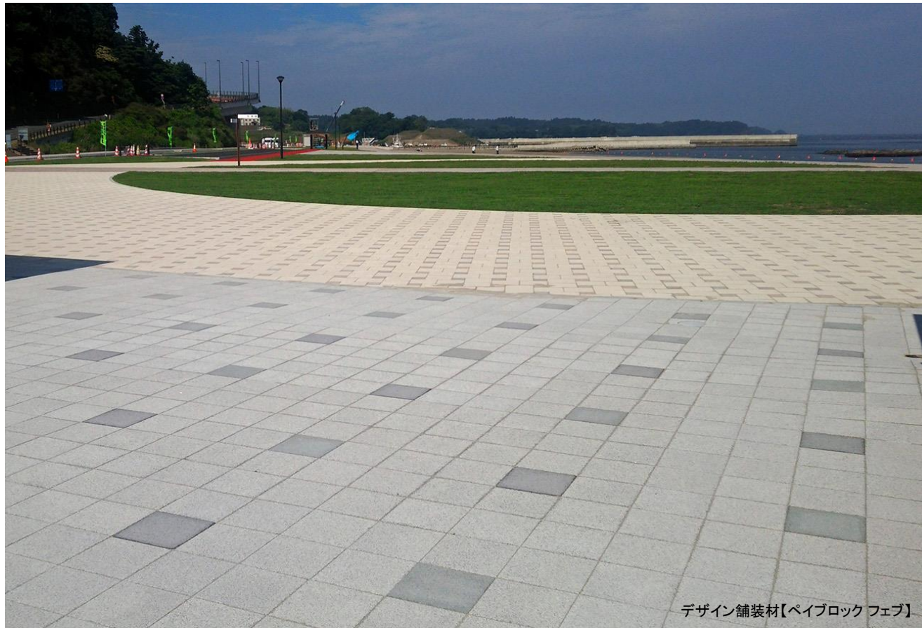
デザイン舗装材【ペイブロック フェブ】