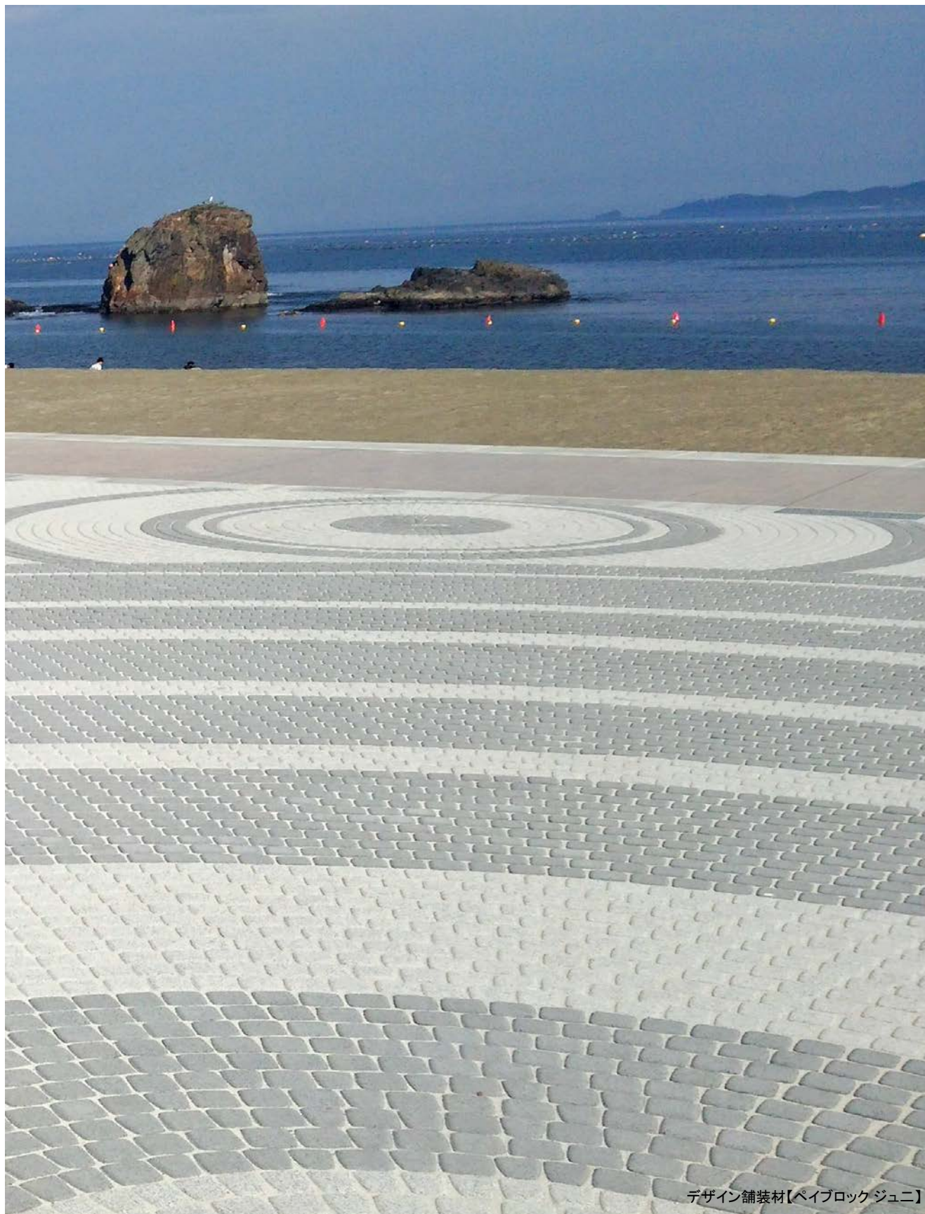
デザイン舗装材【ペイブロックジュニ】