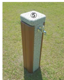
■ストリートファニチュア