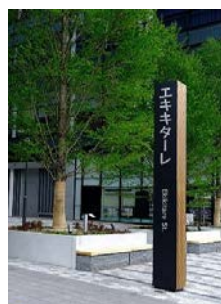
広島駅北口 通称「エキキターレ」