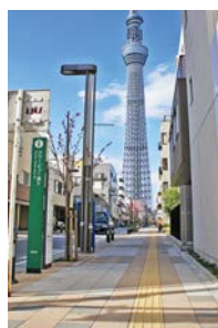
日本での施工事例 タワービュー通り(東京都)