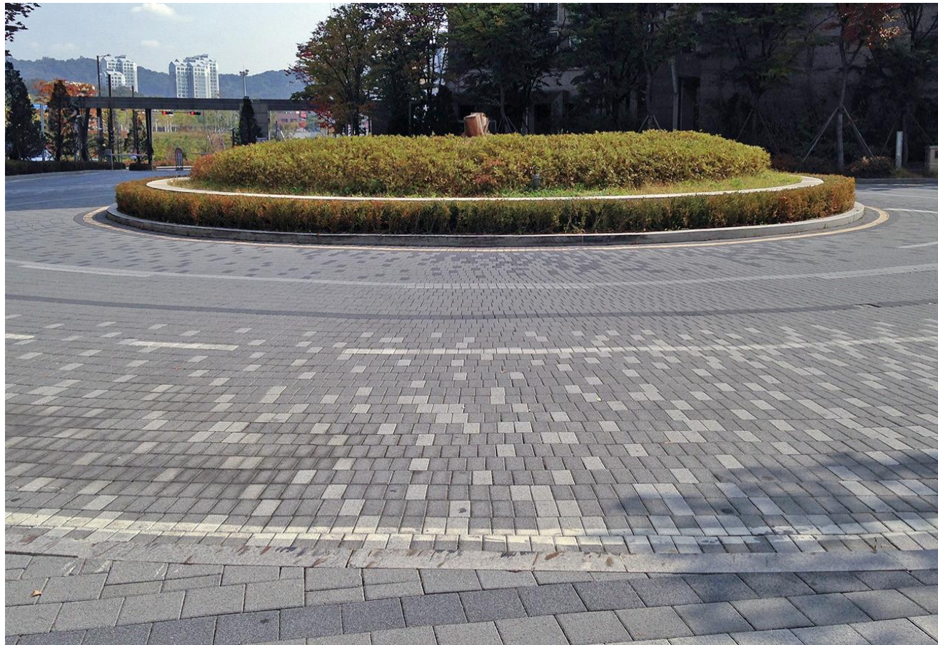
別内 (Byeollae) IPARK