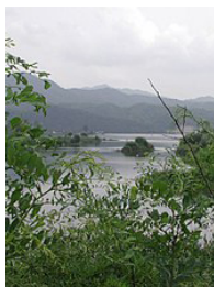
北漢江 南漢江の合流地点

川の合流地点はトゥムルモリと呼ばれ、都会では感じられない自然たっぷりの環境を十二分に満喫できる場所に透水性舗装材【 エコロアクア FS 】を採用いただきました。