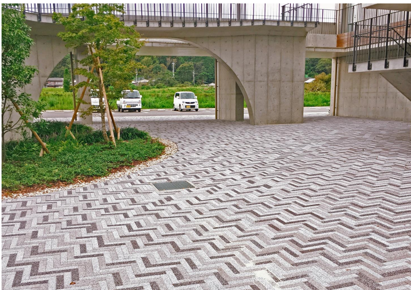
美波町医療保健センター