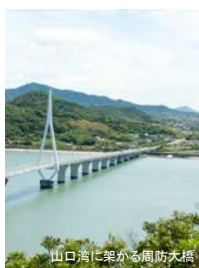
山口湾に架かる周防大橋

設計コンセプトは、新たな「山口の柱」となる駅前広場のあり方を提案しており、街づくりのきっかけとなる駅前広場を通過点でなく目的地として活用するための市民との協働の取り組みが高く評価されています。今回、北口駅前広場と駅舎の在来線のホームに設置されたエスカレーターにデザイン舗装材【テセラ エコロアクア FE(透水タイプ)】特注色スモークグレーを採用いただきました。