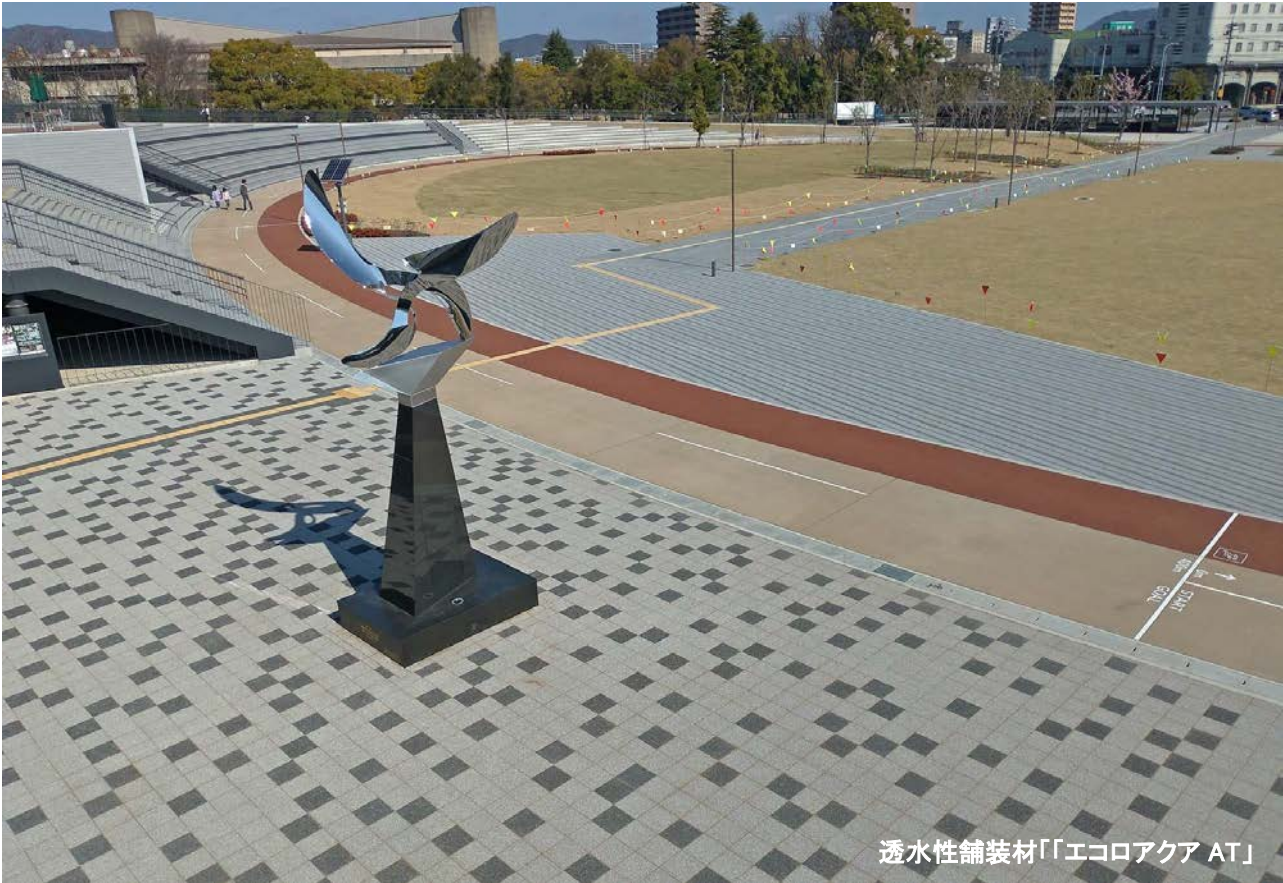
透水性舗装材「エコロアクア AT」