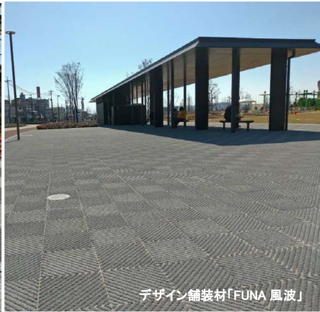
デザイン舗装材「FUNA 風波」