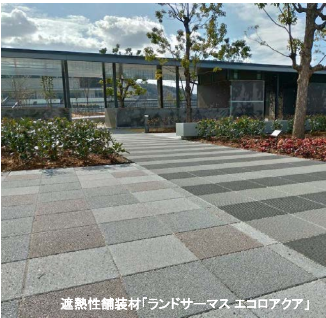
遮熱性舗装材「ランドサーマス エコロアクア」