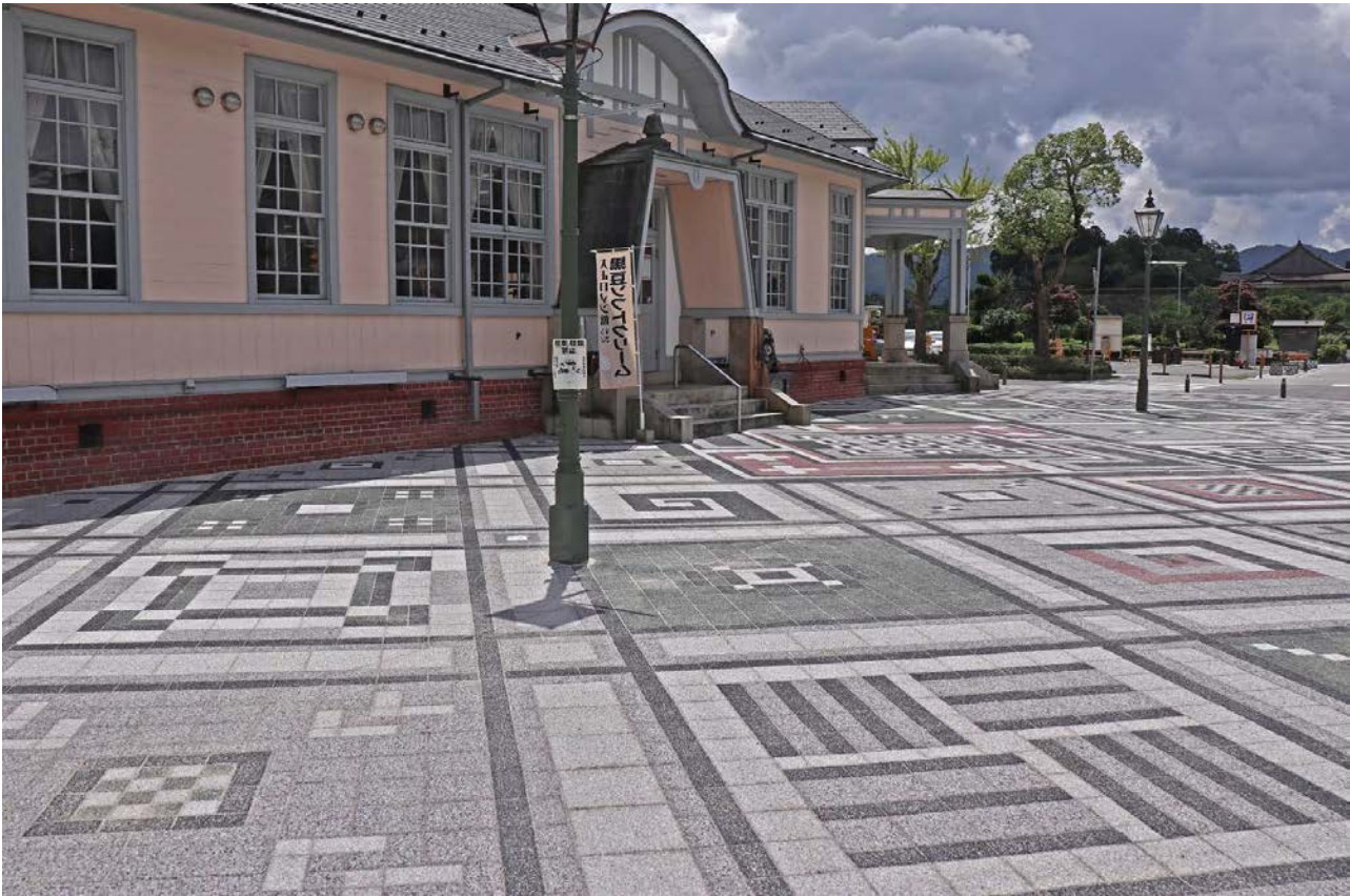
大正ロマン館周辺舗装(市道大手線無電柱化事業)