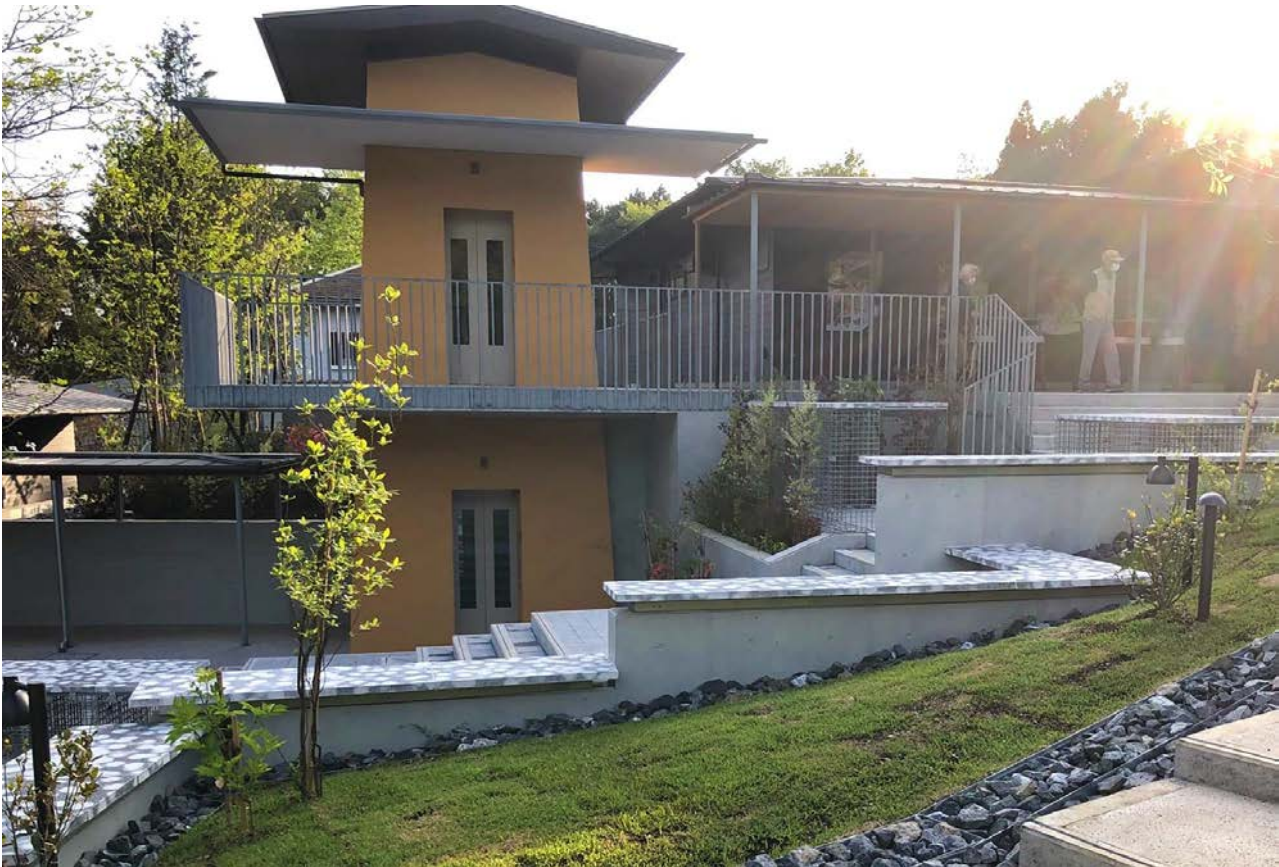
町田薬師池公園 四季彩の杜 ウェルカムゲート