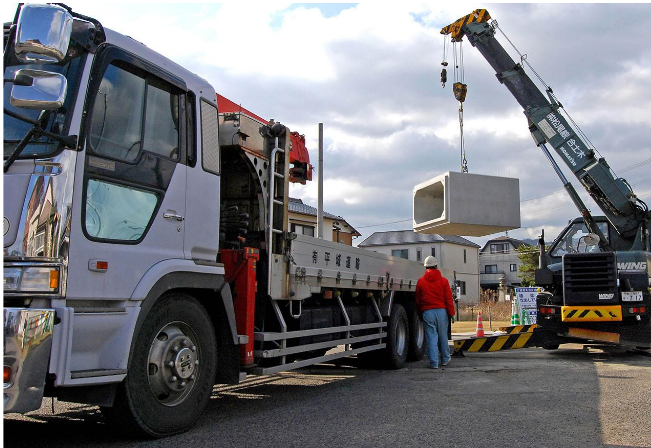
平成28年度市道志度海岸線 橋梁補修工事