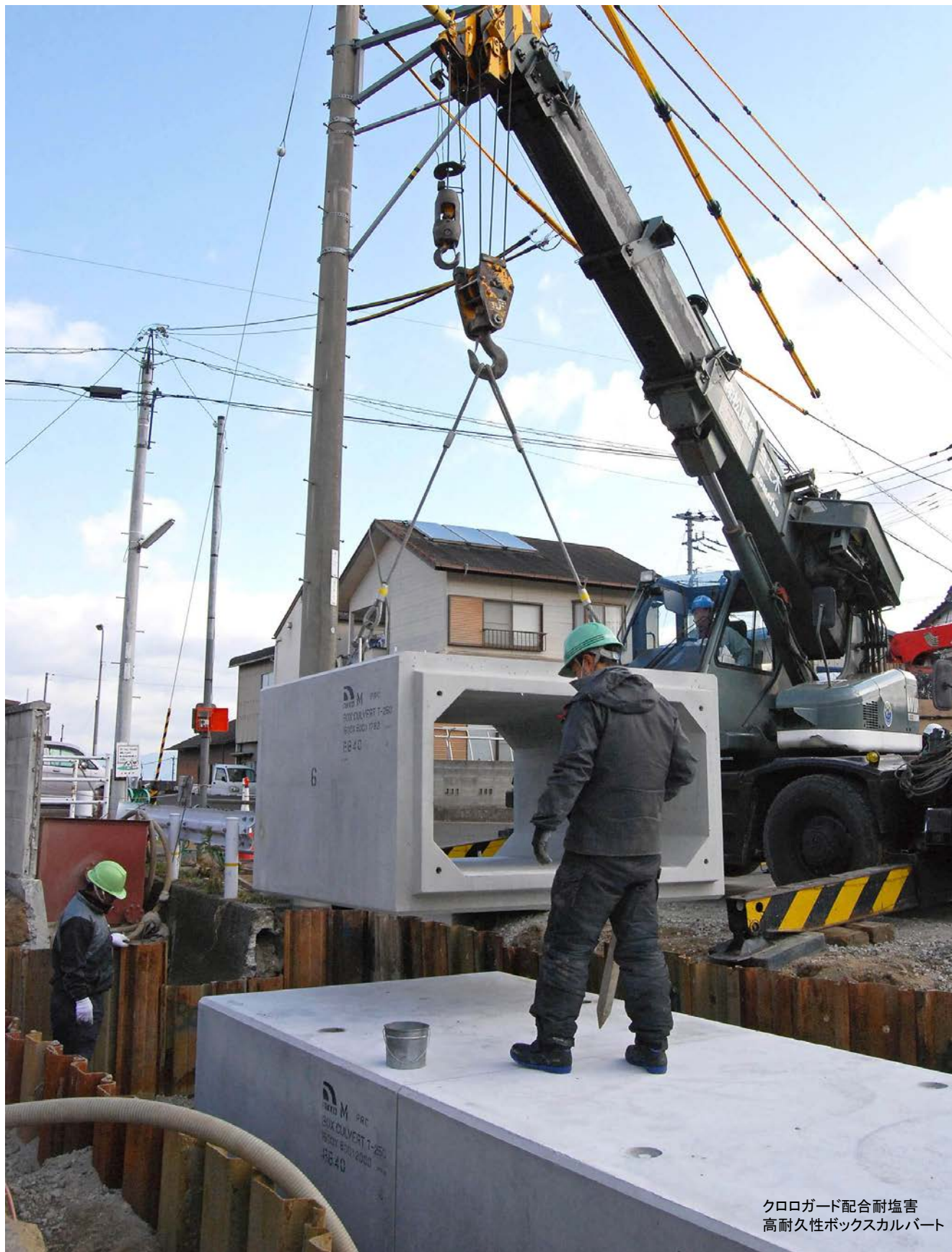
クロロガード配合耐塩害 高耐久性ボックスカルバート