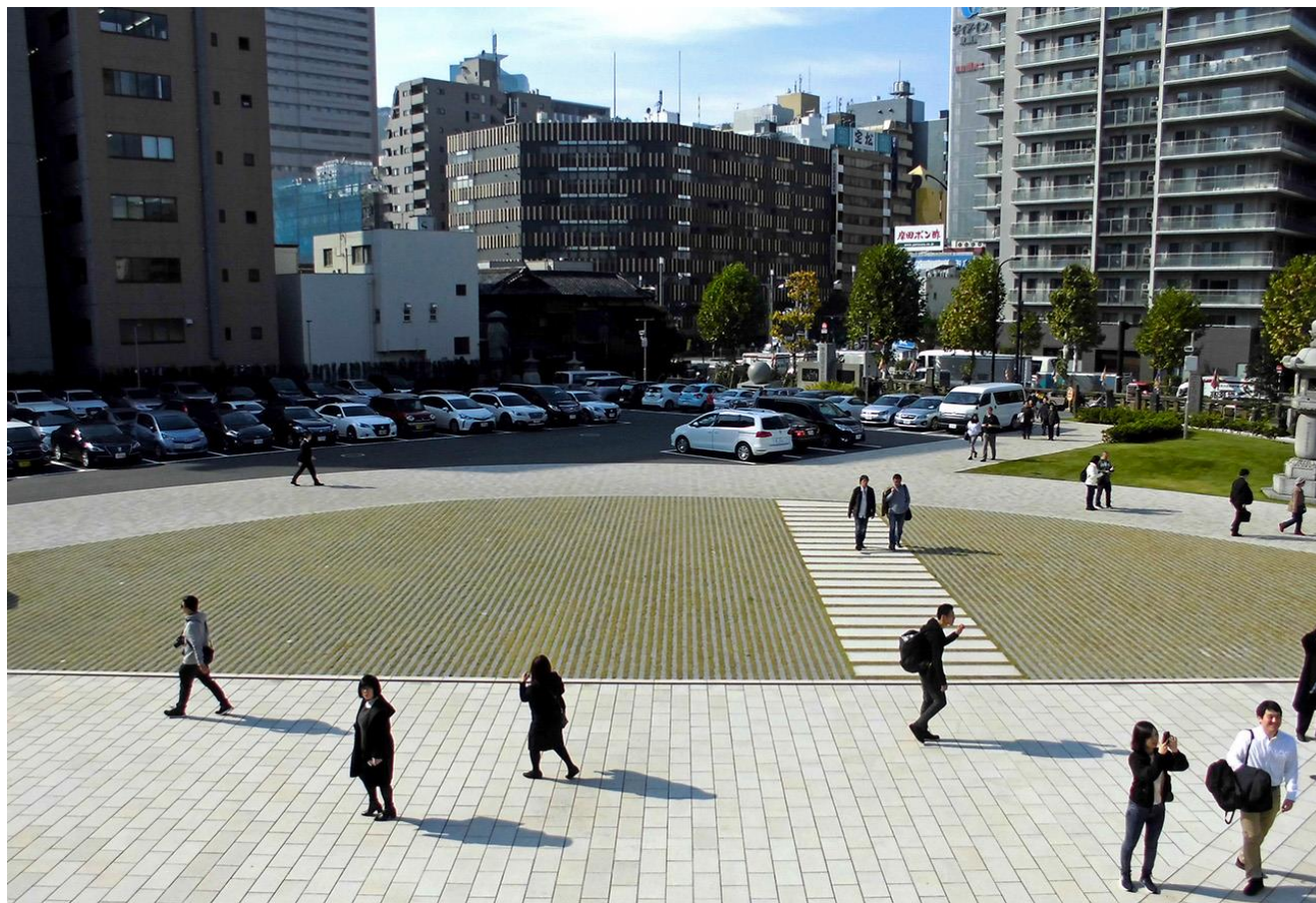
築地本願寺修景整備