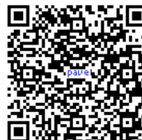
webカタログもご覧下さい