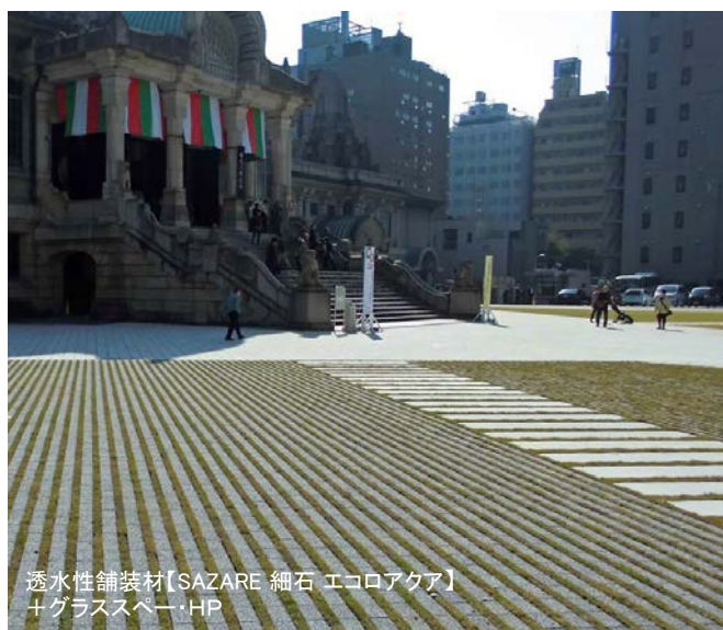
透水性舗装材【SAZARE 細石 エコロアクア】 +グラスペー・HP