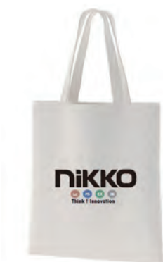
オリジナルトートバッグも好評いただきました！

お忙しい中、ご来場頂きました皆様、誠にありがとうございました。今後とも弊社の流域治水対策製品の、より一層のご愛顧をお願い申し上げます。