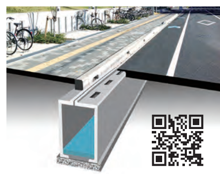
「アクアゲッター（雨水貯留側溝）」紹介動画